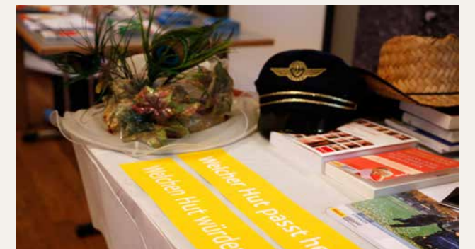
Abendanlass «Alles gesund unter einem Hut!»

Am Abendanlass «Alles gesund unter einem Hut! Mitarbeitende mit familiären Belastungen» erhielten die Teilnehmenden Inputs zum Umgang mit Belastungen im Zusammenhang mit Angehörigenpflege. Die Referenten zeigten Möglichkeiten und Grenzen von Betrieb, Vorgesetzten, Personalverantwortlichen, Arbeitskollegen und Betroffenen selbst auf bei der Vereinbarkeit von Erwerbstätigkeit und Angehörigenpflege. Das Forum BGM Aargau und die kantonale Fachstelle Alter führten gemeinsam diese Veranstaltung durch, um Betriebe, Arbeitnehmende und weitere relevante Akteure für das Thema zu sensibilisieren und miteinander zu vernetzen.